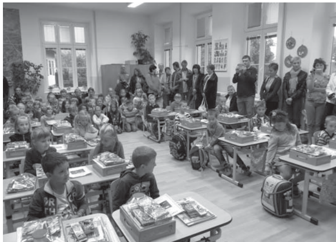
1. září - slavnostní zahájení školního roku

Kapacita školní družiny je 30 žáků. Jen stěží může uspokojit všechny zájemce. Ve škole působí ředitelka, čtyři učitelky a dvě pedagogické asistentky a vychovatelka školní družiny. Žáci mají možnost zúčastnit se mimoškolní zájmové činnosti. Žáci se mohou učit hře na hudební nástroje, na klavír, flétnu a kytaru. Rodiče nemusí děti vozit do města. Je zde také možnost sportovního využití, žáci mohou navštěvovat pozemní hokej, vybíjenou, judo. Starší žáci se mohou zúčastnit kurzu kolečkových bruslí. Veškerá výbava, inline brusle, helmy, chrániče pro všechny účastníky, byla