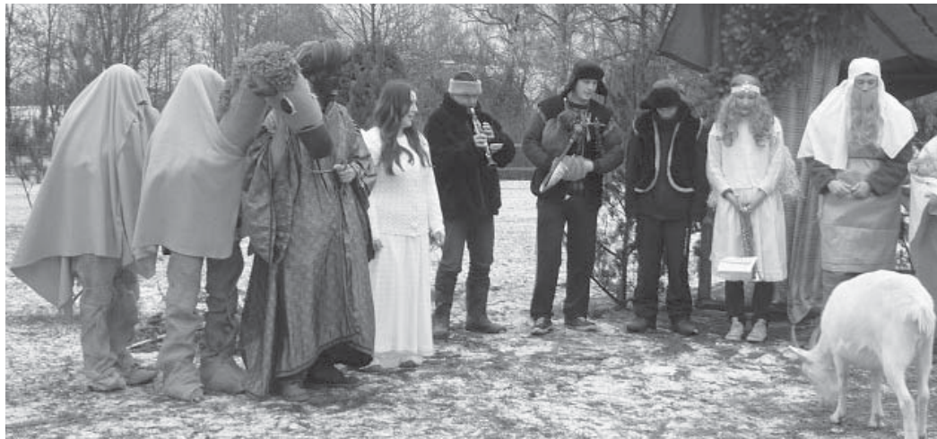
Předvánoční akce vyučujících a žáků SOŠ v loňském adventu.

SOŠ veterinární, mechanizační a zahradnická a Jazyková škola s právem státní jazykové zkoušky Rudolfovská 92 v Českých Budějovicích pořádá ve dnech 10. - 11. 12. 2015 tradiční vánoční výstavu. Ve čtvrtek 10. 12. je možné si výstavu prohlédnout v době od 10:00 do 17:00, v pátek 11. 12. od 9:00 do 12:00. V klubu domova mládeže přímo v areálu školy bude možné vidět vyzdobený vánoční stůl, návštěvníci se mohou pokochat ukázkami vánočních tradic a zvyků Vánoc, budou nabízeny ukázky tradičních a moderních Vánoc z jižních Čech. Na výstavě budou také prezentovány výrobky a tradice Vánoc připravené studenty oboru Zahradnictví. Tito studenti mimo jiné také touto výstavou prezentují své maturitní projekty. Mezi vystavované výrobky budou patřit adventní věnce závěsné a stolní, stolní svícný chvojně i bez chvojí, hřbitovní svícný, různá vánoční