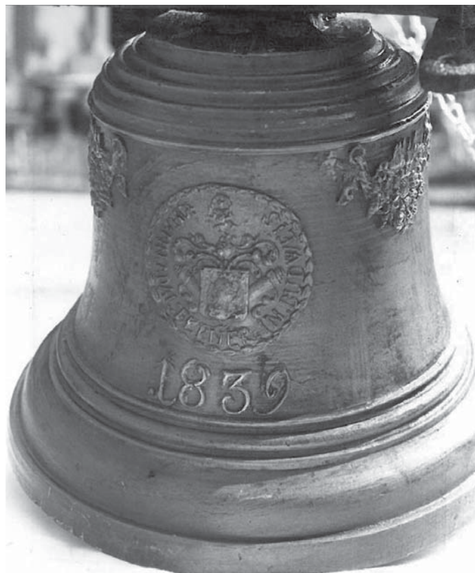
Zvon sv. Florián z roku 1839. Hmotnost asi 50kg, největší spodní vnější průměr v cm 25 cm, výška až k okraji zvonu 35 cm.

(Kdo víte více o příběhu hůreckých zvonů, budeme rádi, když se s námi o tyto informace podělíte. Redakční rada)