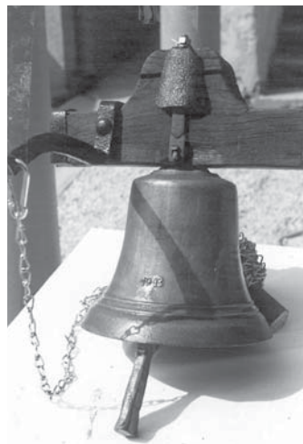
Poplachový zvonek ze zinku, tzv. Šturmováček