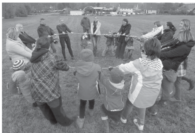
Dračí hry s rodiči

Přes začáteční těžkosti jsme společně podnikli již mnoho procházek do okolí školky. Postupně se náš okruh zvětšoval, a tak nám nožičky i těch nejmenších dovolily (v září ještě „bolavé nožičky“), vypravít se v říjnu až ke škole do Nedabyly na ukázkou sokolnictví, která byla pro děti velkým zážitkem. K podzimním měsícům neodmyslitelně patří vítr, který vynese draky do oblak. Děti ze školky se svými rodiči také zkusili své štěstí vypustit draky do výšin, ale vítr dlouho ani