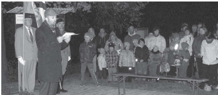
Starostův proslov u pomníku padlým.