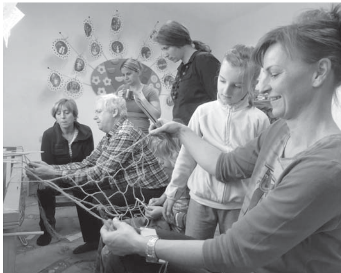
Pletení základního uzlu není úplně jednoduché.

Několika odvážlivcům se podařilo příjemně strávit první únorovou sobotu ve školce. Tentokrát nebyly hlavními aktéry děti, ale dospělí, kteří měli zájem naučit se pletit sítě. Šest žen a jeden šikovný žák základní školy se na kurs pletení dostavili již v devět dopoledne. Ve školce sice nemáme pec, za kterou bychom si vlezli, ale ob- sadili jsme topení s ohrádkou, a ta se stala kotvištěm pro všechny naše výtvořky při pletení. Do oběda jsme se proplétali základním uzlem, jehož provedení není úplně jednoduché. Cílem tvoření se nám staly nástěnkové sítě, houpací síť a nebo síťová taška. Celé odpoledne, někteří až do půl páté, jsme pracovali na svých výtvořech a hovořili. Cítila jsem se jako v pohádce, když ženy derou peří a při tom vypráví dobrodružné