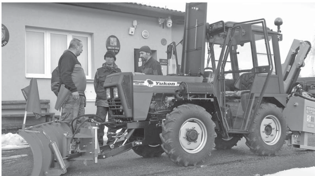
Zástupci obce při přejímce traktoru od technika firmy Wisconsin z Prostějova.