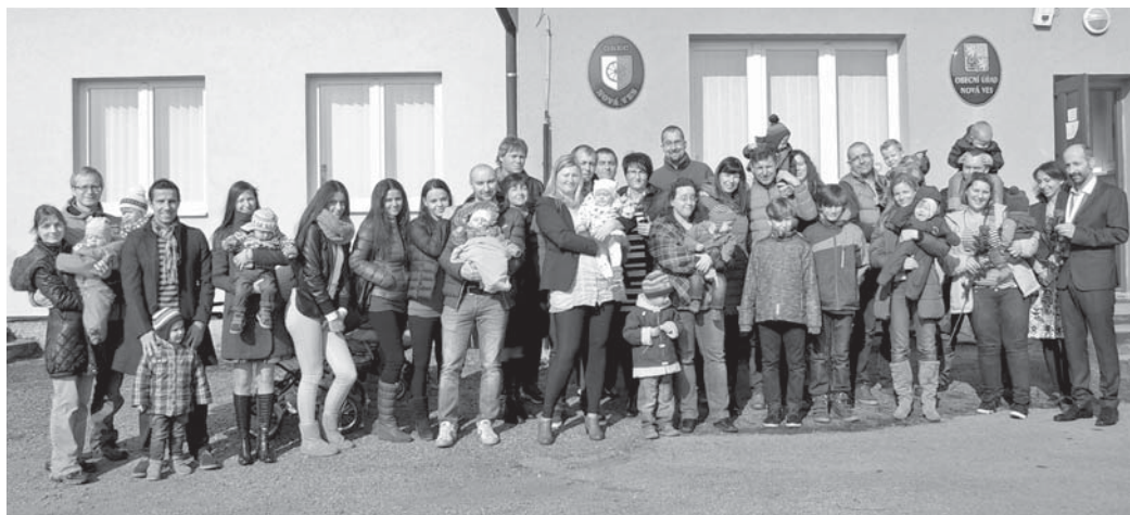
O letošní vítání občánků byl mezi blízkými brífubuznými velký zájem.