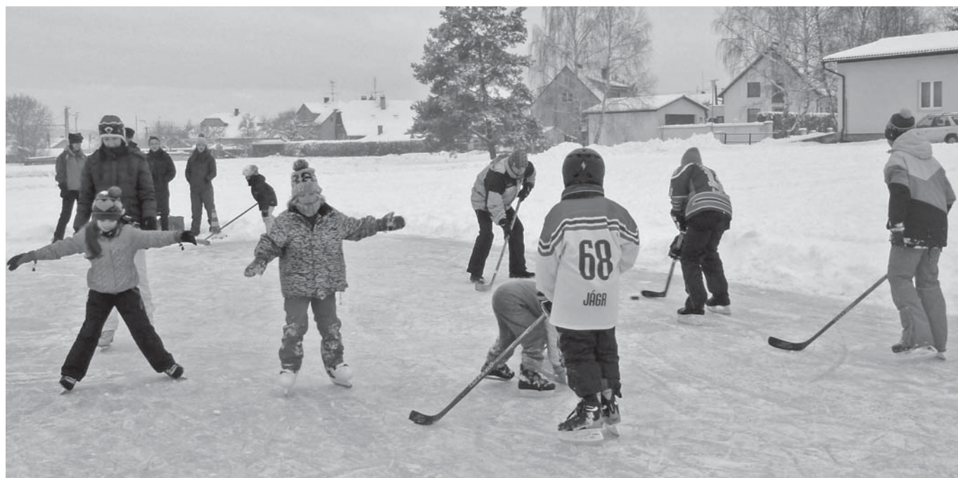
O bruslení na přírodní ledové ploše byl zájem nejen mezi dětmi.